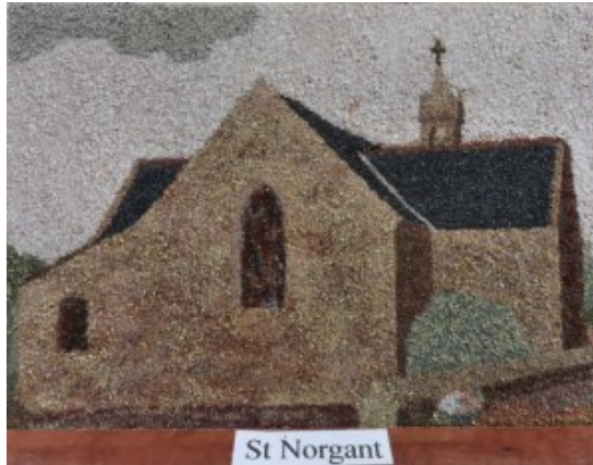
L'église de Saint-Norgant par Antoine Troël (2016)

Merci, Antoine ! Et surtout, continuez !