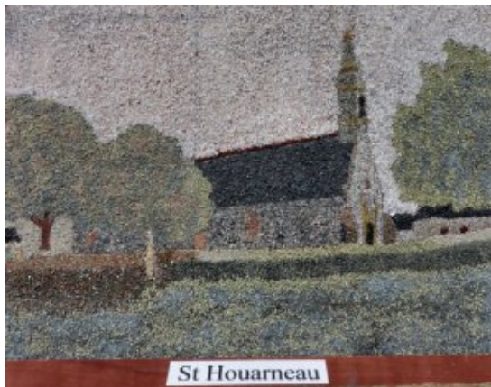
La chapelle de St-Houarneau en Bourbriac par Antoine Troël (2016)