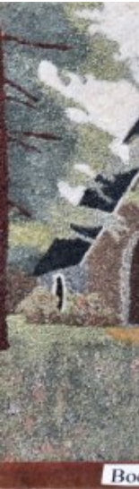
La chapelle de Bodfo en Bourbriac par Antoine Troël (2016)