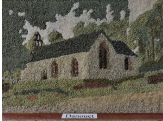
La chapelle du Danouet en Bourbriac par Antoine Troël (2016)