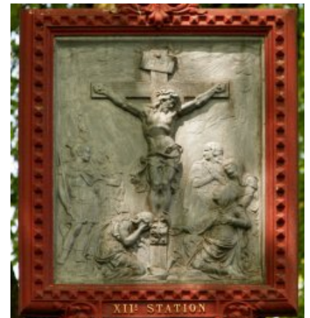
Station XII : Jésus meurt sur la croix <a

href="http://paroisse-bourbriac.catholique.fr/docrestreint.api/1598/6ae63c0cfa7687b09c9d10c58c24661bda56b794/jpg/12_red.jpg" title="" type="image/jpeg">