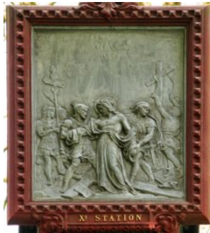
Station X : Jésus est dépouillé de ses vêtements <a

href="http://paroisse-bourbriac.catholique.fr/docrestreint.api/1597/75cc67edc7ee1258ecd7d96343d845c94326b584/jpg/11_red.jpg" title="" type="image/jpeg">