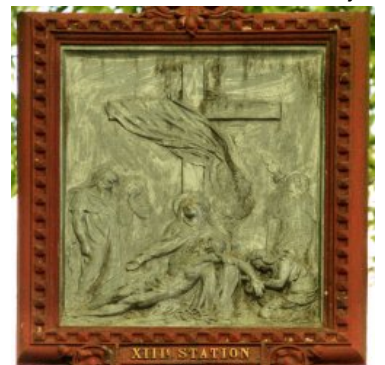
Station XIII : Jésus est descendu de la croix et son corps est remis à sa Mère <a

href="http://paroisse-bourbriac.catholique.fr/docrestreint.api/1599/b35c1d34c3bc0909ba3d30223288ad73a99abe27/jpg/13_red.jpg" title="" type="image/jpeg">