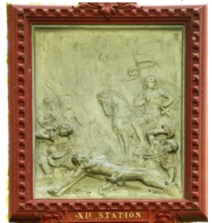
Station XI : Jésus est cloué sur la croix <a

href="http://paroisse-bourbriac.catholique.fr/docrestreint.api/1597/75cc67edc7ee1258ecd7d96343d845c94326b584/jpg/11_red.jpg" title="" type="image/jpeg">