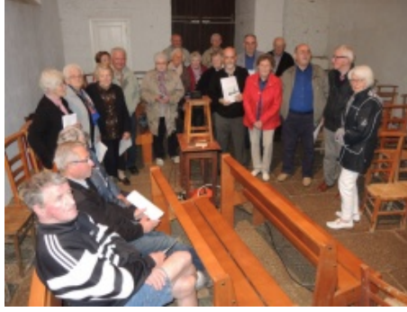
Kérien : les personnes présentes