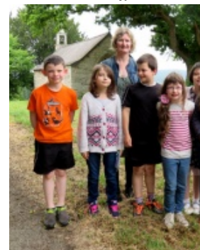
Les écoliers de Saint Briac

<a href="http://paroisse-bourbriac.catholique.fr/docrestreint.api/1680/cddc2fb759c10d85613b5679a932ecf00ce69506/jpg/st_briac_patrimoine_2016.jpg" title="" type="image/jpeg">